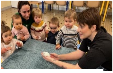
Médiation animale St Aubin D'Arquenay