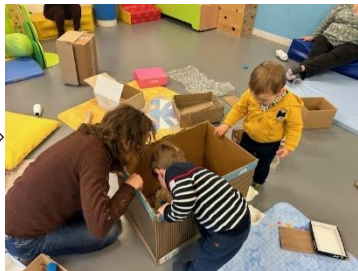
Inter-Relais Eveil Pop ⇨ Ouireham

Inscriptions à partir du Mardi 02 Avril 2024