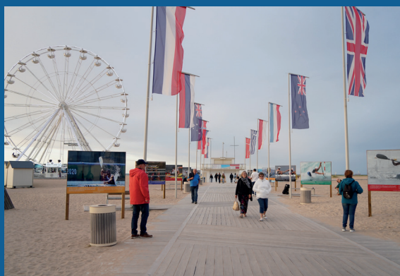
Promenade de la Paix sur la plage, lieu emblématique de la cérémonie du 70 ème anniversaire du Débarquement, qui se prolonge d'est en ouest depuis 2014.

Vice-Président de Caen la mer Ports, Littoral et Tourisme