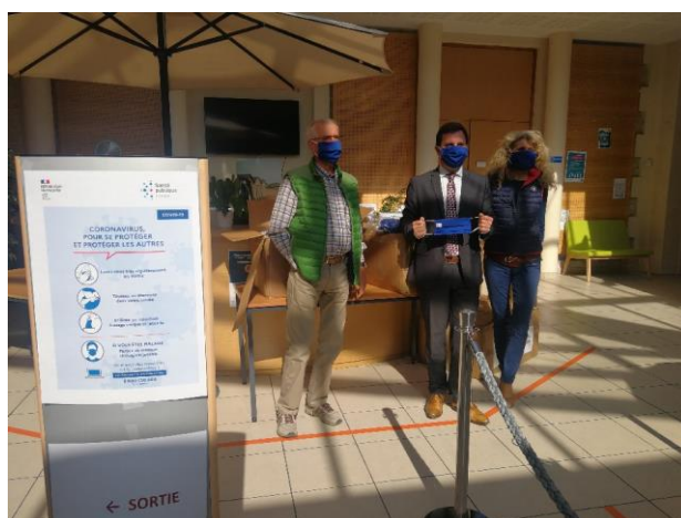
10 000 masques sont arrivés à l'Hôtel de Ville, ce mercredi 13 mai.

Le desserrement du confinement a été instauré par l'État depuis le lundi 11 mai. Il revient à la Ville de le décliner au plan local et de mettre en œuvre les conditions sanitaires nécessaires. Au-delà des aides sanitaires et sociales mises en place par la Ville depuis le début du confinement ainsi que de la cellule de crise déployée dès le lundi 16 mars au matin, nous avons anticipé les besoins et procéderons ainsi à la distribution d'un masque pour tous les habitants (résidences principales et secondaires) du jeudi 14 au samedi 16 mai. Pour ce faire, deux actions parallèles doivent être distinguées :