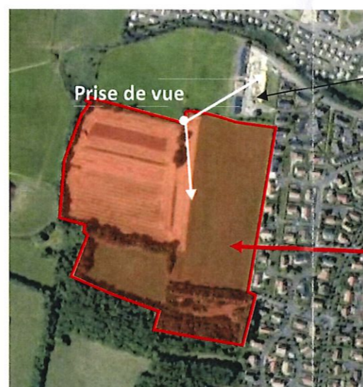
Vue aérienne, extrait google earth, sans échelle