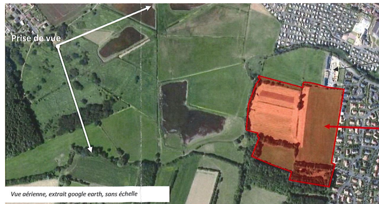
Vue aérienne, extrait google earth, sans échelle