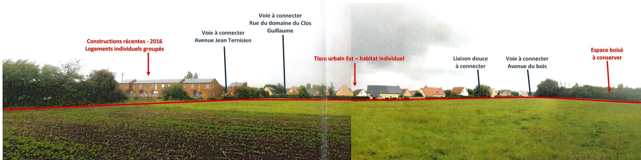
Vue depuis l'angle Nord-Ouest de l'emprise du projet