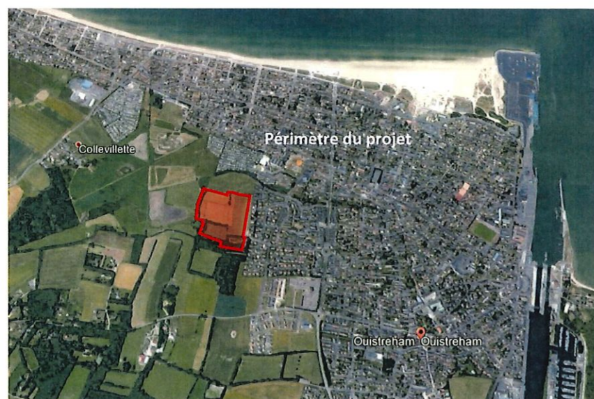
Vue aérienne, extrait google earth, sans échelle