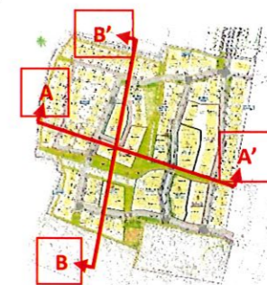
Plan de localisation des coupes