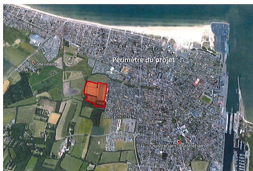
Vue aérienne, extrait google earth, sans échelle