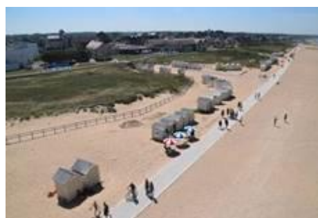
Partie Est (phase 3)

Prises de vue au 6 juillet 2019