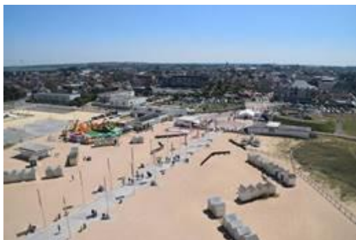
Tronçon central (phase 1)

Inauguration : samedi 24 août 2019, à 18h30