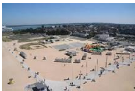
Partie Ouest (phase 2)