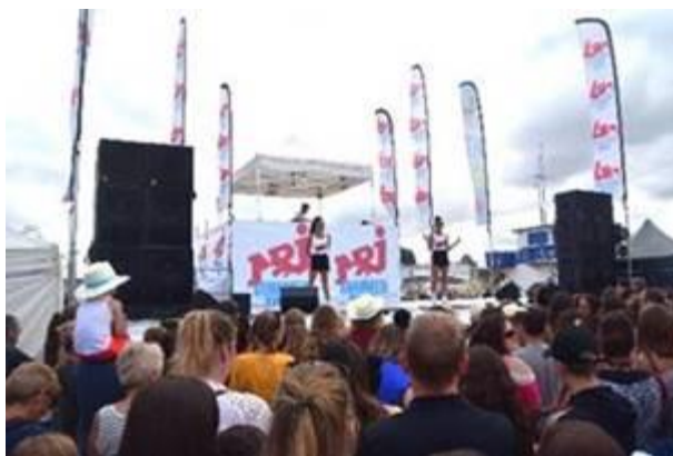
© C. Lesage - Ville de Ouistreham Riva-Bella