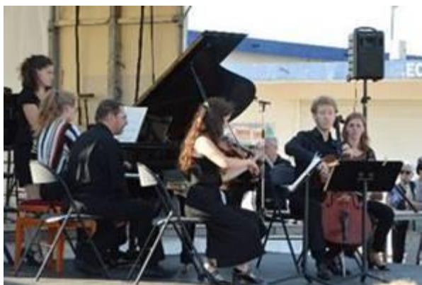
© Académie Musicale Internationale de la Côte de Nacre