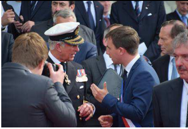
6 juin 2014 – Cérémonie internationale du 70 e anniversaire du Débarquement, sur la plage de Ouistreham Riva-Bella

Le 18 janvier 2017, après avoir obtenu l’approbation du Conseil Municipal, la commune de Ouistreham Riva-Bella a lancé le concours de Maîtrise d’œuvre pour la construction du Centre d’interprétation des relations franco-britanniques sur la plage de Sword Beach, à Ouistreham Riva-Bella.