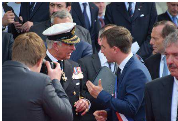
6 juin 2014 – Cérémonie internationale du 70 e anniversaire du Débarquement, sur la plage de Ouistreham Riva-Bella

Conférence de presse le mardi 4 avril 2017, de 9h15 à 10h